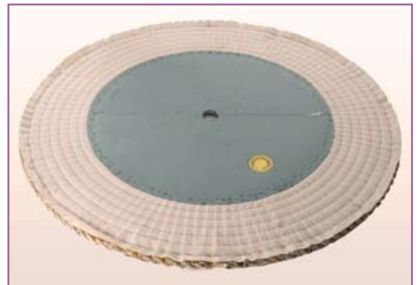
art. 1118 Ø 1600 mm.

per lavori pesanti di pulitura con robot. È il disco che più si adatta alla pulitura robotizzata di particolari sagomati di tutti i metalli. Questo articolo unisce il vantaggio di una notevole durata (grazie all'impregnazione dei tessuti) al completo rispetto della macchina pulitrice (in particolare delle pinze dei robot)