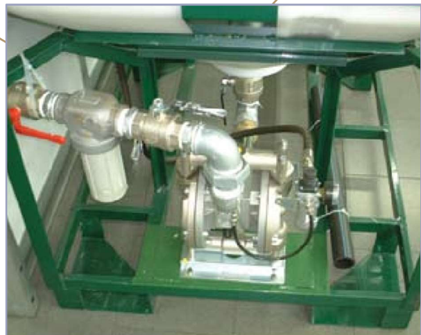
Montaggio di Pompa e Filtro sul Siletto